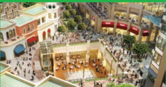
FunLab / 2016 Emaar Boulevardi İstanbul / 4.000m 2