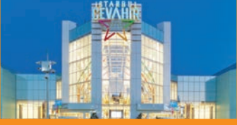
FunLab Cevahir AVM İstanbul / 16.000m 2