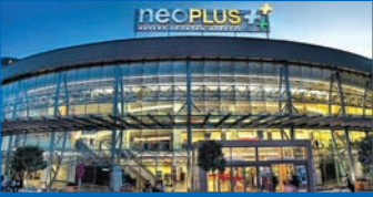
FunLab NeoPlus Outlet AVM Eskişehir / 3.500m 2