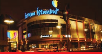
FunLab Forum İstanbul AVM İstanbul / 3.500m 2