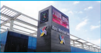
FunLab Kent Meydanı AVM Bursa / 400m 2