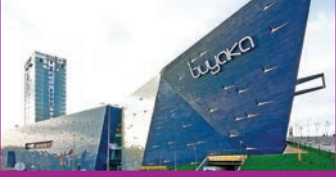
FunLab Buyaka AVM İstanbul / 600m 2